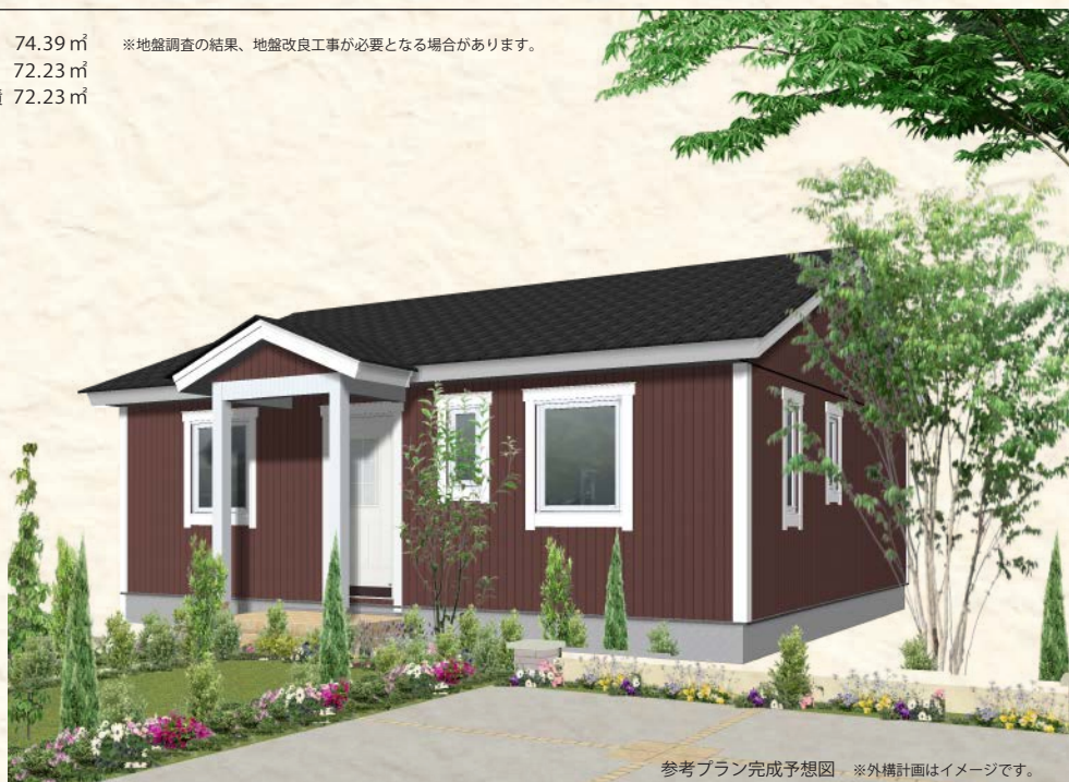
参考プラン完成予想図 ※外構計画はイメージです。