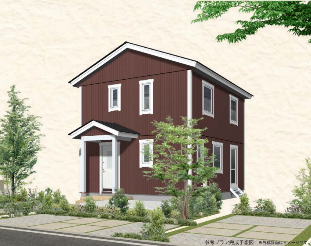
参考プラン完成予想図 ※外構計画はイメージです。